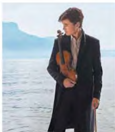
Ο σουνδός βιολονίστας Daniel Lozakovich

Το έργο αυτό έχει τη δική του δύναμη γιατί, όπως λέει η Ζωή Τσόκανου, είναι διαμάντι. «Με λίγα μέσα ο Γιώργος Αξιώτης καταφέρνει να δημιουργήσει πολύ όμορφα πνοχρώματα. Χειρίζεται την ορχήστρα με έξυπνο τρόπο που νχει και λειτουργεί. Ο ήχος είναι ατμοσφαιρικός και λυρικός. Μια λυρικότητα που δίνεται από τα έγχορδα αλλά με πάρα πολύ ωραία μείξη χρωμάτων από την υπόλοιπη ορχήστρα. Δεν είναι ένα κλασικό λυρικό ιντερμέτζο. Έχει ξεσπάσματα ρυθμού που δίνουν έναν δραματικό χαρακτήρα στο έργο, το οποίο είναι πολύ σύντομο. Διάρκει μόλις έξι λεπτά. Η ΚΟΘ έχει παίξει αρκετές φορές και ένα άλλο έργο του Γιώργου Αξιώτη, το “Δειλινό”. Εχουμε μπει